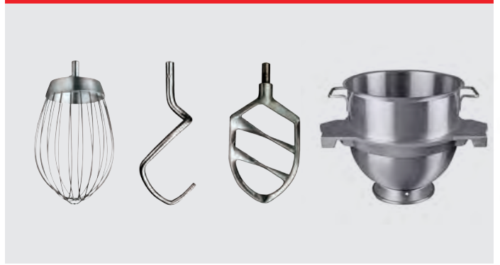
Ris, krog, spartel og kedel 60/30 liter i rustfrit stål.