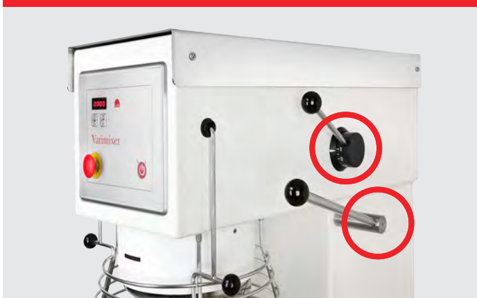
VL-1 – Manuel hastighedsregulering og manuel kedelsænkning