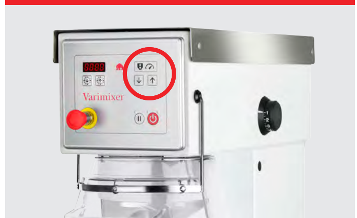
VL-1S – Automatisk hastighedsregulering og automatisk kedelsænkning