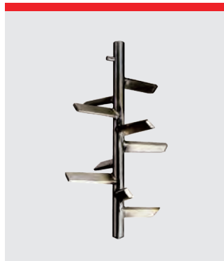
Pulverblender, rustfrit stål