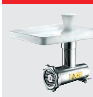
Kødhakker, 70 mm