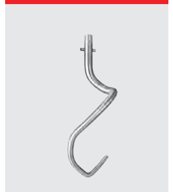
Krog med to stifter til pizza