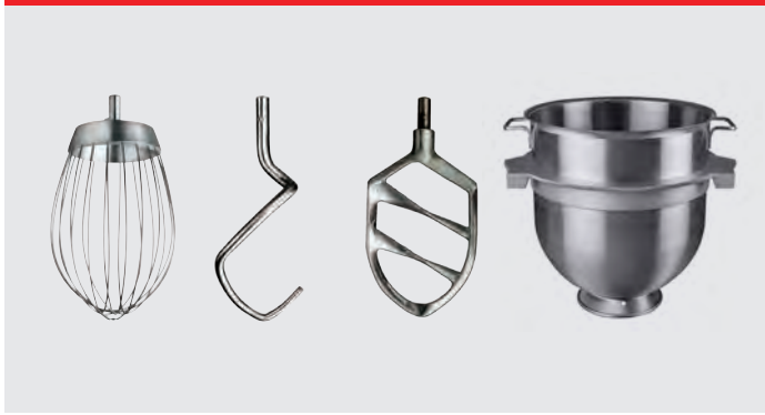
Ris, krog, spartel og kedel 60 liter i rustfrit stål.