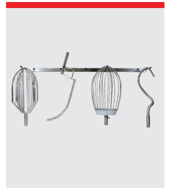
Ophæng til værktøj, 127 cm