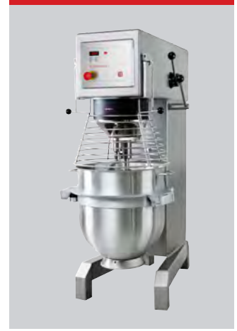
Marineversion, rustfrit stål