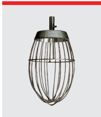
Ris med forstærkning