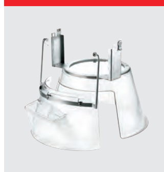
Aftagelig sikkerhedsskærm i plastik. CE-certificeret