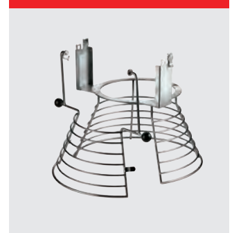
Aftagelig sikkerhedsskærm i rustfrit stål. Ikke CE-certificeret