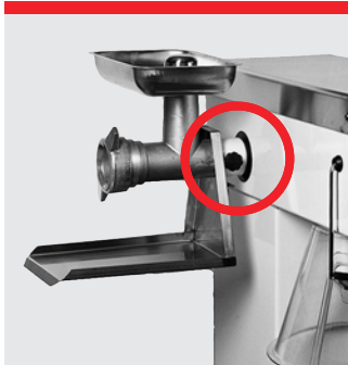
Hjælpetræk til kødhakker og grønsagsskærer