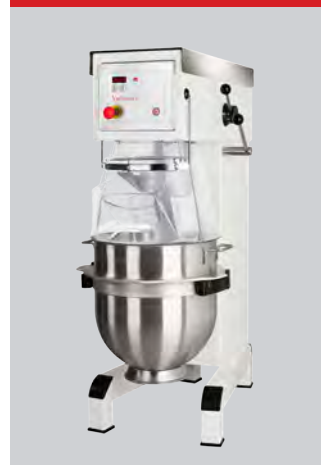
Pizzaudgave, hvid, pulverlakeret