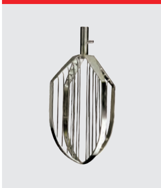
Røreris, rustfrit stål