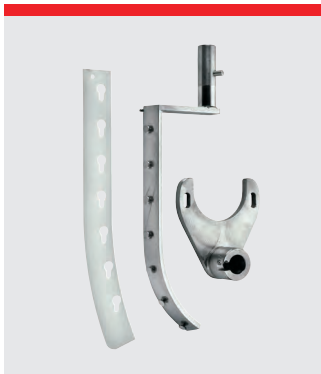
Automatisk skraber, rustfrit stål. Nylon- eller teflonblad. 60 l og 60/30 l.