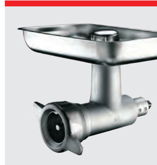
Kødhakker, 82 mm