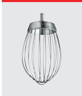
Ris med tyndere tråde, rustfrit stål