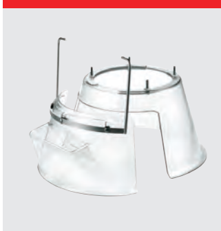
Fast sikkerhedsskærm i plastik. CE-certificeret