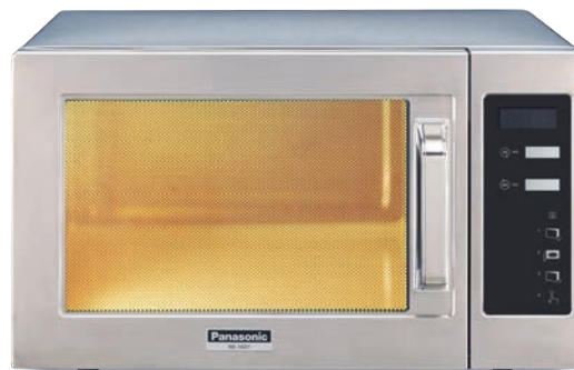
NE 1037 AUTO