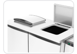
Hygienic waste deposit through sealed lids