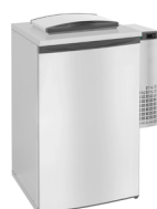
V5-1 | V6-1

V6 | Monoblock Kühlanlage – Die monoblock Kühlanlage kombiniert hohe Leistung und niedrigen Stromverbrauch mit einfachen plug-in Einbau.