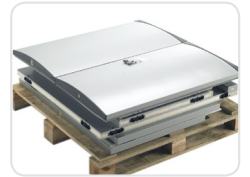
Flat packed modular panels