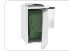
Interior dimensioned for 240L wheelie bins