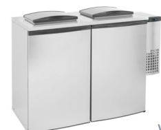
V5-2 | V6-2