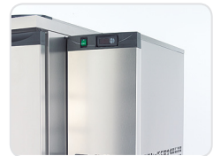
Quick and easy side fitting

V5 | Waste Disposal Coolers – MERCATUS waste disposal coolers are the ideal equipment for commercial kitchens and other bacteriologically sensitive environments.