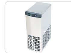
High performance monoblock cooling unit