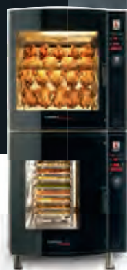
CONVEX® Combi-Tower CKT2000