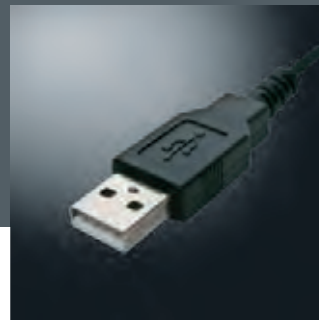
Einfaches Software-Update durch USB-Schnittstelle. Easy software update via USB-slot.