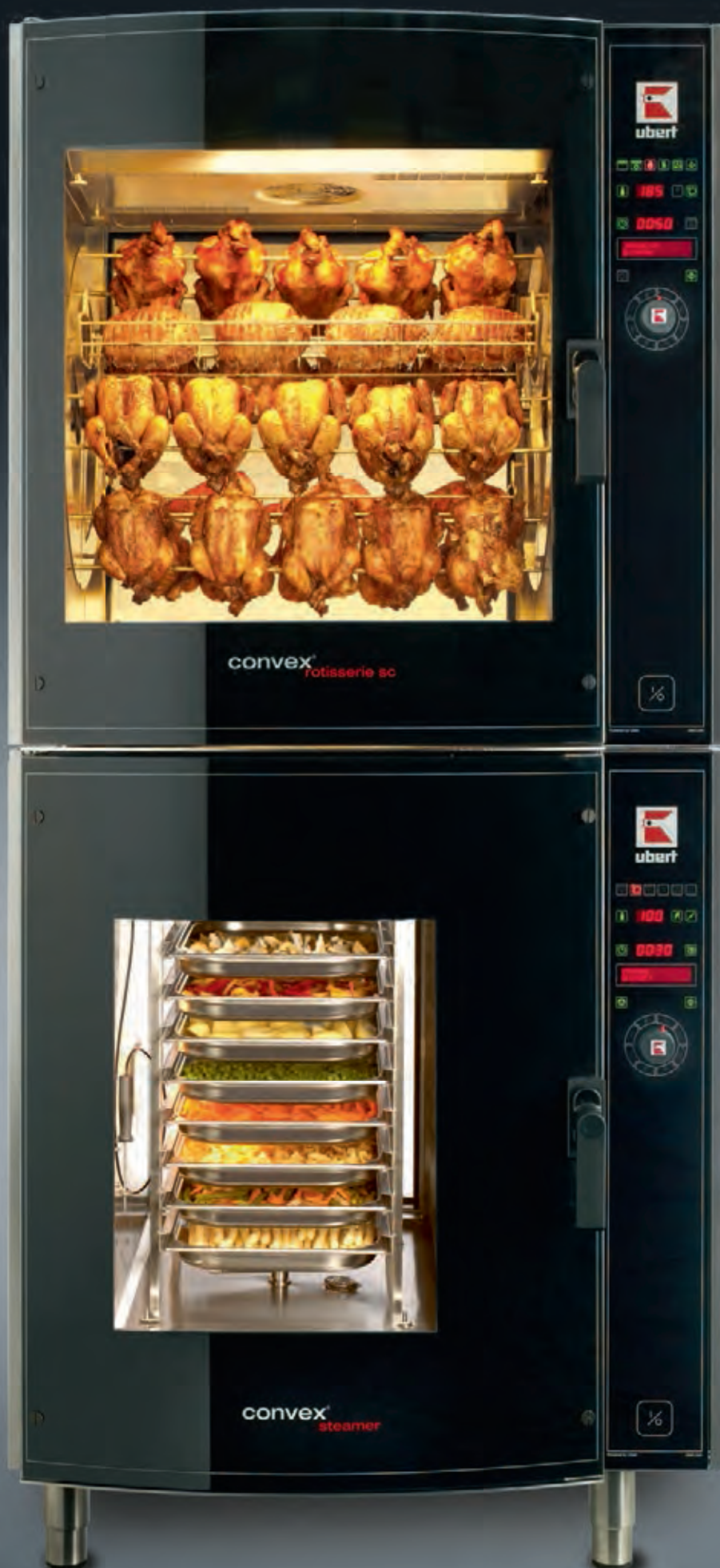
CONVEX® COMBI-TOWER CKT2000