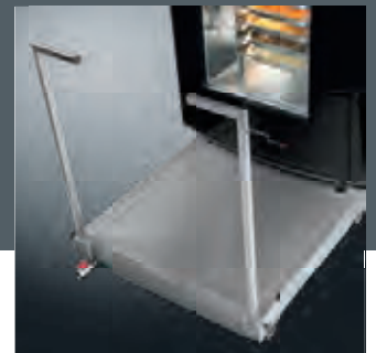
Unauffällig und praktisch: Der optional erhältliche, integrierte Fettwagen. Discrete and practical: The optional fat collection drawer.