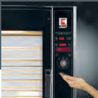
Intuitive Bedienungsführung durch Klarschriftdisplay. Intuitive operator control with easily read display.

Whether you take the sophisticated computer system, the low surface temperatures of the double-glazed doors or the optional fat collection drawer - working with the CONVEX® Combi-Tower CKT2000 is a piece of cake. The combined setup of the CONVEX® Combi-Tower CKT2000 in addition to the double-sided operation avoids long distances between the prep and sales areas. The CONVEX® Combi-Tower CKT2000 is also ahead of its time in terms of energy efficiency, achieved by its compact construction coupled with shorter preheat and cooking times.