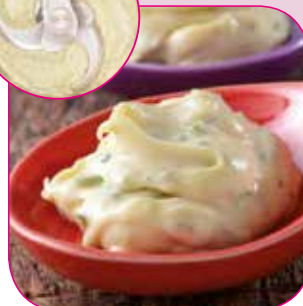
Sås och emulsioner

Lättöverskådlig manöverpanel i rostfritt stål. Utrustad med en programmerbar timer (0-15 minuter), och puls för exakt kontroll av beredningen.