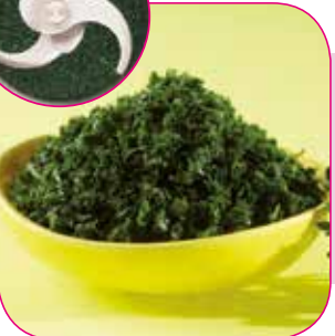
Finhackning av örter