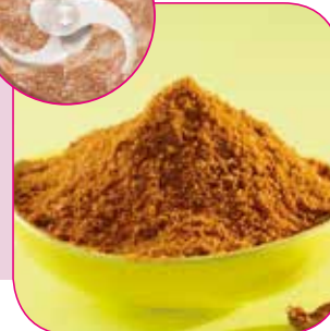
Malning av kryddor