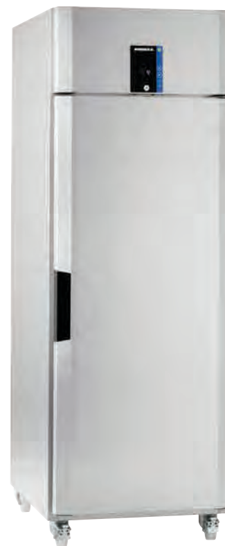
Porkka INVENTUS C7 med alternativ hjul