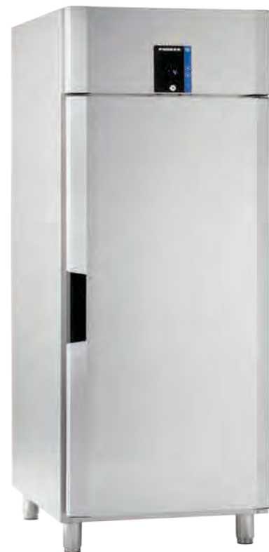
Porkka INVENTUS C8