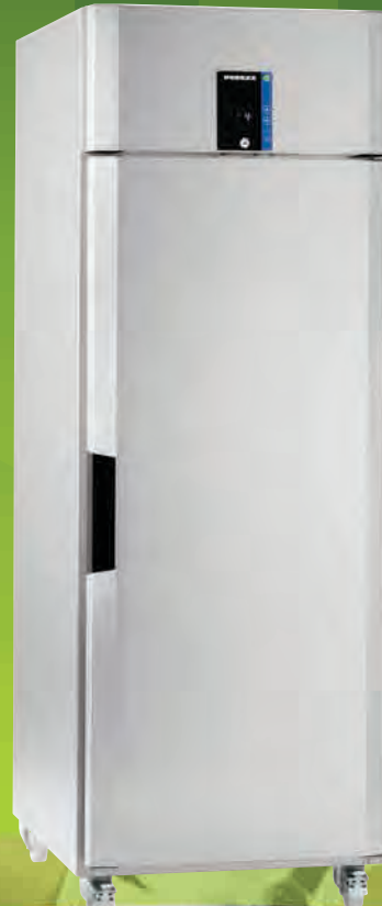
Inventus CX7 Viser valgfrie hjul