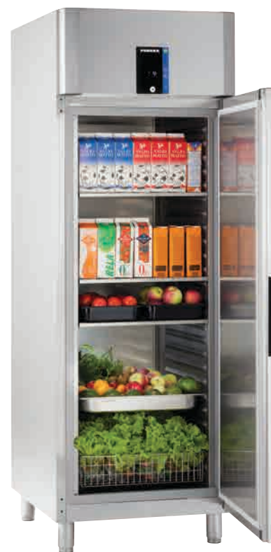
Porkka INVENTUS CX7