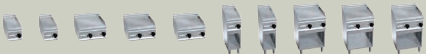
E6FL3B E6FL3BP E6FL3BP/CR

Eine große Auswahl an Gas- oder Elektro-Bratplatten mit Stahl- oder Chromplatten in Einzel- oder Doppelausführung ermöglicht die Zubereitung unterschiedlichster, selbst empfindlichster Speisen direkt auf der Platte. Die gleichmäßige Temperaturverteilung garantiert optimales Garen ohne Wärmeverluste, und führt zu einer beachtlichen Energieeinsparung und zur Schaffung einer angenehmeren Arbeitsumgebung. Die Bratreste werden mit Hilfe der eigens hierfür vorgesehene Sammelrinne über eine große Ablauföffnung in eine großzügig dimensionierte Auffangwanne geleitet. Hitzebeständiger Teflonstopfen als Optional erhältlich.