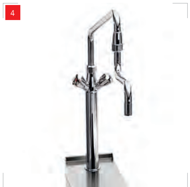
4. NEUTRAL UNIT colonnina orientabile "kwc" a canna snodabile con drip-stop "kwc" swivel column with articulated barrel with drip-stop flexible orientable "kwc" articulé avec drip-stop schwenkbare säule "kwc" mit beweglichem schlauch mit Drip-Stop