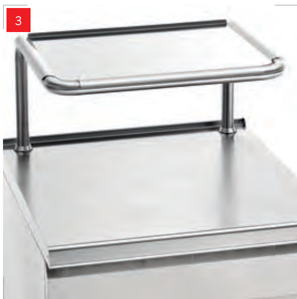
3. NEUTRAL UNIT supporto per salamandra • support for salamander support pour salamandre • salamander-traeger