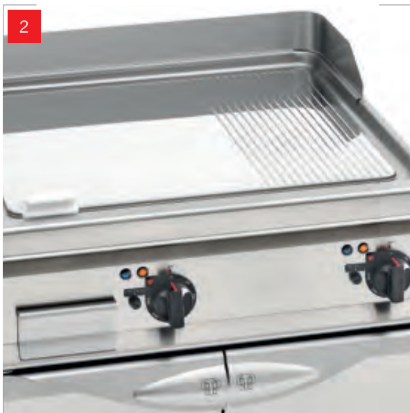
2. FRY TOP paraspruzzi • splashguard écran anti-eclaboussures • spritzschutz