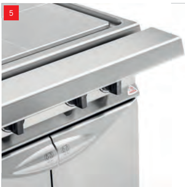
5. Maniglione corrimano distanziatore Handrail shackle spacer Poignée main courante entretoise Handlauf griffe abstandsstück